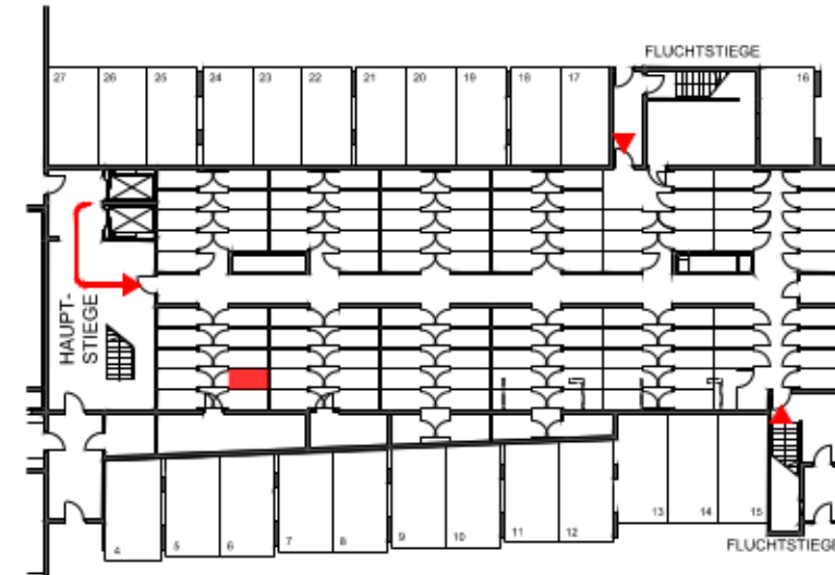
ÜBERSICHT EINLAGERUNGSRÄUME KELLERGESCHOSS (ohne Maßstab)